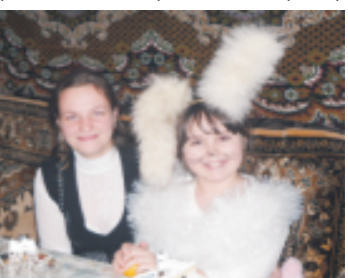
«Словно маленький проказник, пусть веселым будет праздник» (ном. «Семейные праздники» Л.Тарасова)