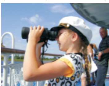
«Путешествие» (ном. «Семейные путешествия» О.Анохина)