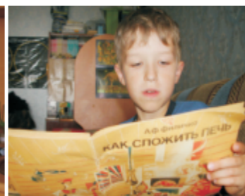
«Серега» (ном. «Семейное дело» А.Нелюбин)