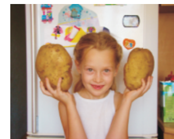
Картофельный Чебурашка (ном. «Семейное дело» Е.Романова)

2. Участие в конкурсе объединяет семью, дает возможность окунуться в прошлое, вспомнить и строить планы на будущее. Проведение в кругу семьи вечера – это та малость, которой порой не хватает в нашей стремительной жизни. Спасибо организаторам за этот добрый конкурс. Хочется, чтобы больше людей посмотрели свои домашние фотоархивы и зарядились добрыми эмоциями.