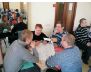
Определение направлений работы профсоюза

Такой семинар будет проведен еще 30 ноября. Всего пройдут обучение 98 вновь избранных лидеров профсоюзных групп.