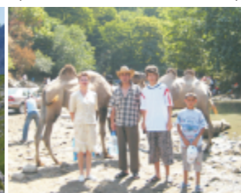
«Таких бы животных к нам в хозяйство...» (ном. «Семейные путешествия» Е.Мусаева)