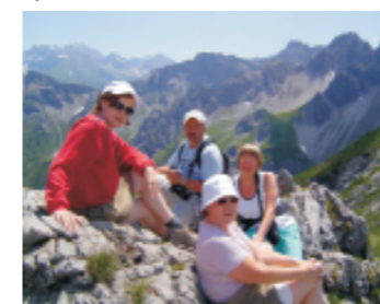
«Альпы. Гора Скала» (ном. «Семейные путешествия» Т.Кран)