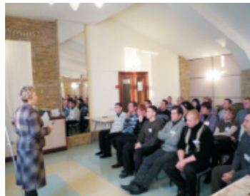
Знакомство с правовым обеспечением деятельности профсоюза

Лидеры профсоюзных групп познакомились с историей образования профсоюзного движения в мире и на нашем предприятии, со структурой горно-металлургического профсоюза России. Правовой и технической инспекторы труда ГМПР рассказали о