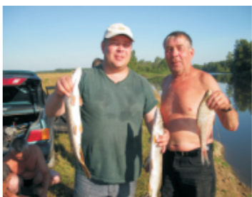
«Подарок любимым» (ном. «Семейное увлечение» М.Зяблицев)