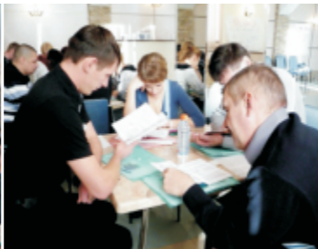
Изучение методического пособия для профгруппорга

правовом обеспечении профсоюзной деятельности, о работе уполномоченных по охране труда и проводимой аттестации рабочих мест. Отдельный блок семинара был посвящен порядку вступления в профсоюз и организованному учету членства.